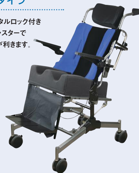
フレーム重量17kg (Lサイズ)