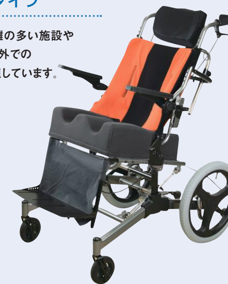
フレーム重量21kg (Lサイズ)