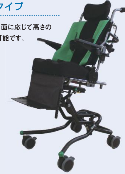
High-Low (R82) フレームに取り付けて使用します。